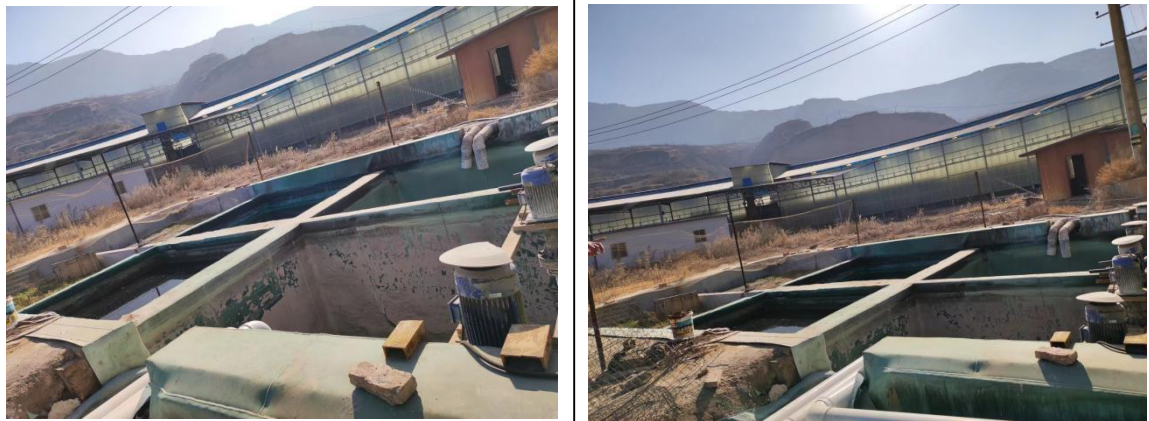
脱硫塔废水循环水池