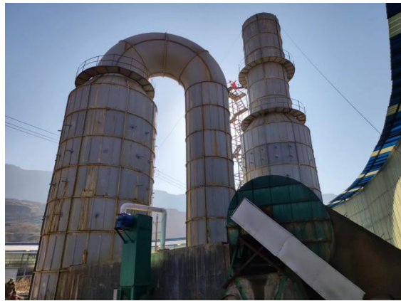
隧道窑脱硫塔和袋式除尘器