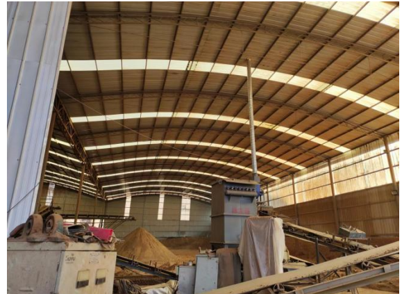
制坯车间布袋除尘器